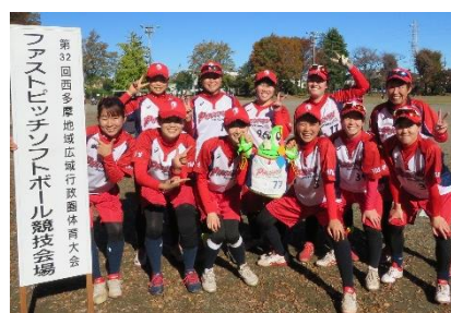
ファストピッチソフトボール女子