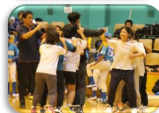
スーパーむかで [小学生の部]